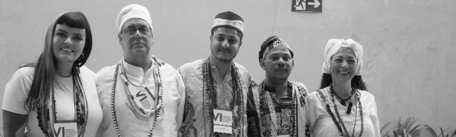
Foto do VI SEMINÁRIO DE PATRIMÔNIO CULTURAL DE VARGINHA

A Umbanda, por sua vez, é uma religião sincrética que mescla elementos do Candomblé, Catolicismo, Espiritismo e tradições indígenas. Ela tem uma abordagem mais inclusiva, muitas vezes trabalhando com a ideia de caridade e assistência espiritual.