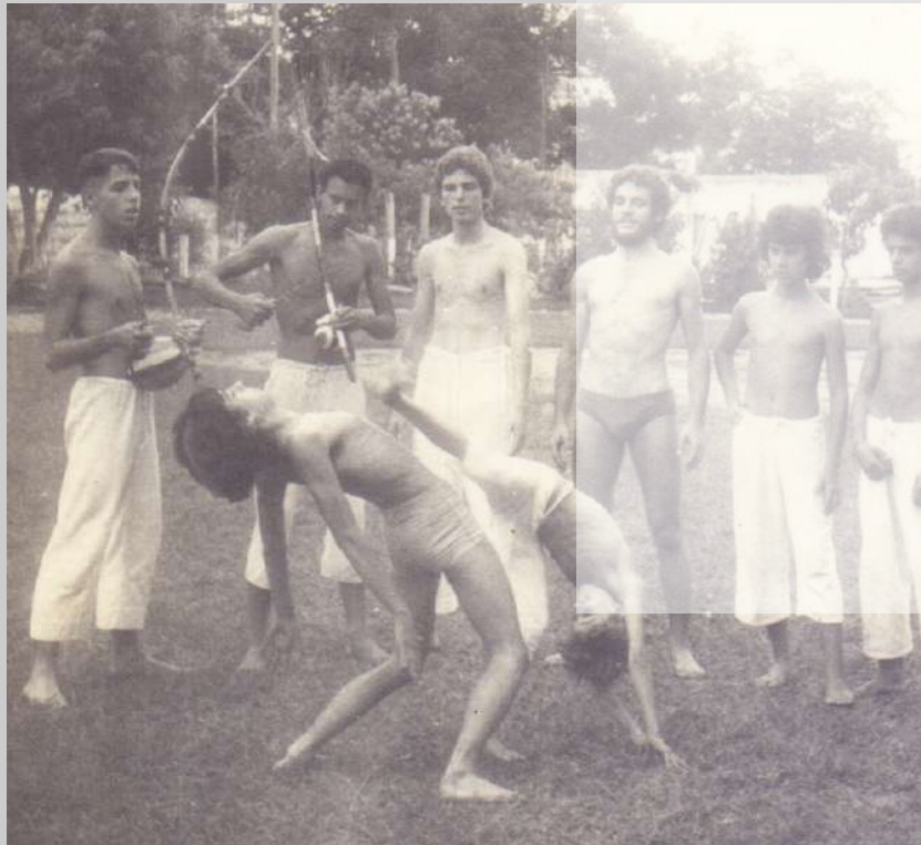
Capoeiristas de Varginha; Acervo: MÁRCIO MORVAN OLIVEIRA