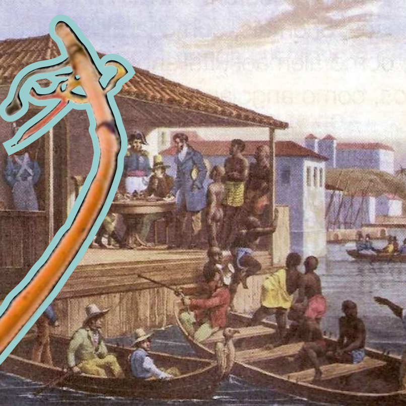
Pintura de Rugendas mostra Cais de Valongo, principal mercado de escravizados, no Rio de Janeiro

Em Minas Gerais é possível perceber a influência da cultura africana na arquitetura, na culinária, na arte, na língua, nas religiões, na música, nas festas, nas danças, entre outros.